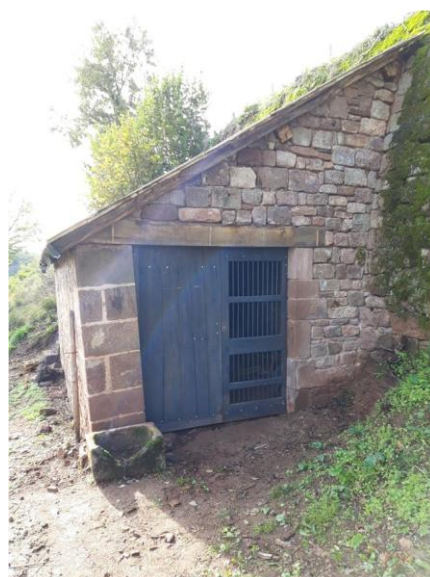
Fin des travaux