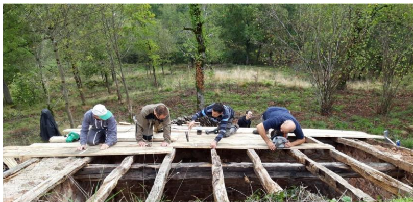
Les bénévoles à l'œuvre