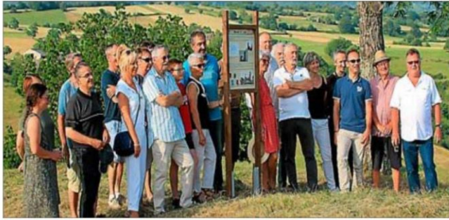
Des panneaux informatifs ont été installés sur l'ensemble du site.

Les promeneurs peuvent ainsi retracer l'histoire du château au gré des panneaux informatifs installés sur l'ensemble du site. Un grand merci à Thibaut de Rouvray qui a participé au travail de recherches historiques pour la réalisation des sup-