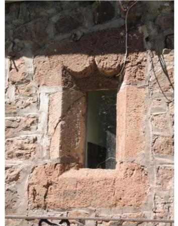
Maison Laurent à Grandsanhes