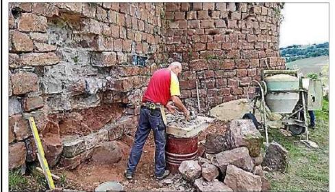
TRAVAUX. La renaissance du château

Ce sera également l'occasion de rencontrer les compagnons maçons et tailleurs de pierres qui viennent tout juste de terminer le chantier de sauvegarde des vieilles murailles. Démonstrations de taille et explications des techniques employées... chacun est invité à venir satisfaire sa curiosité. Accueil du public de 11 heures à 17 heures ; tables de pique-nique et buvette sur place.