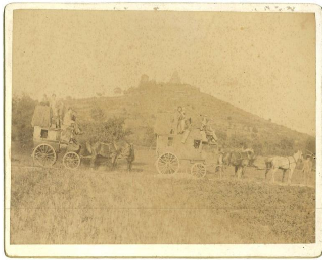
Vue du site en août 1894